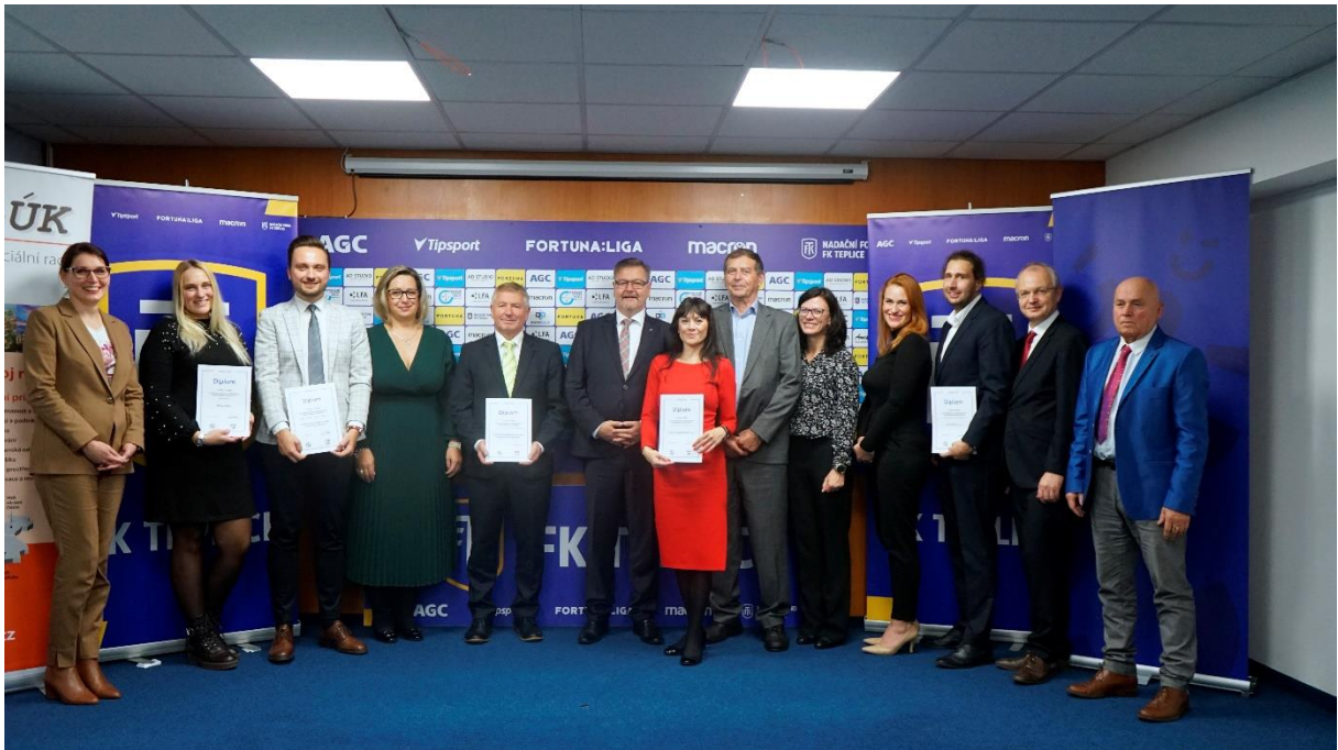
Vítězové 7. ročníku Ceny hejtmana za společenskou odpovědnost