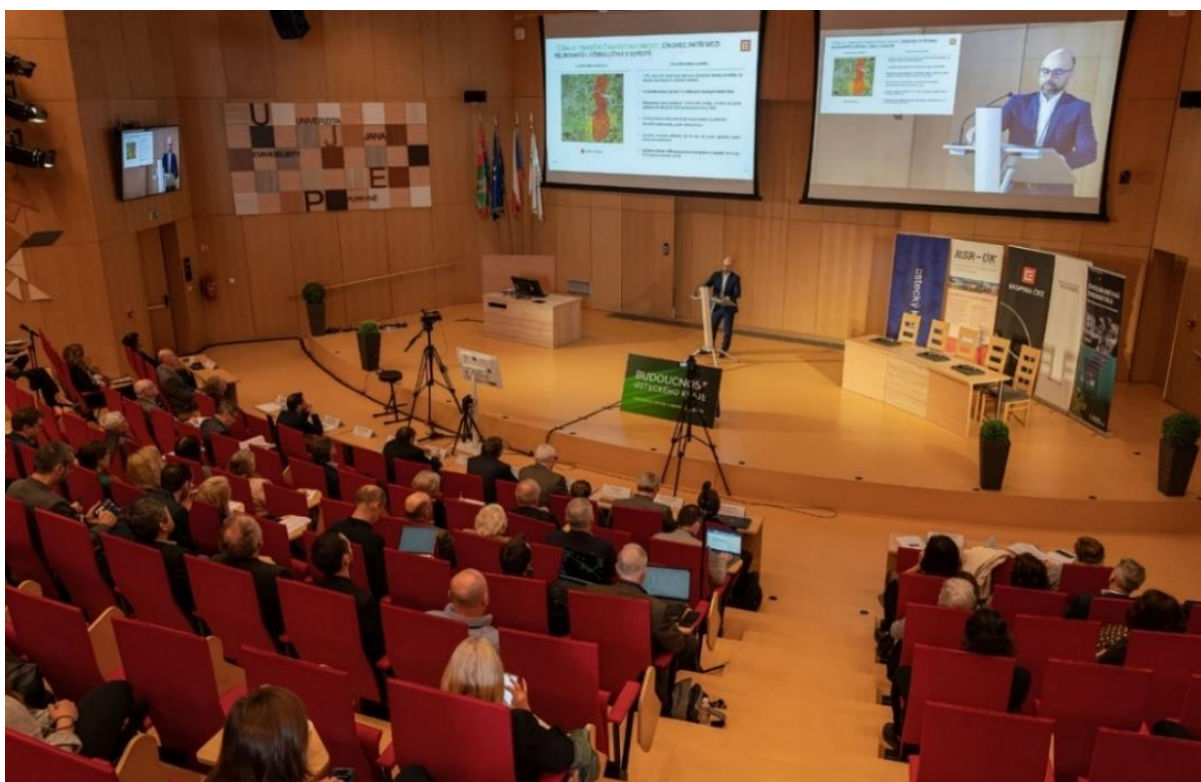
Konference „Budoucnost Ústeckého kraje“ v červené aule Univerzity J. E. Purkyně v Ústí nad Labem