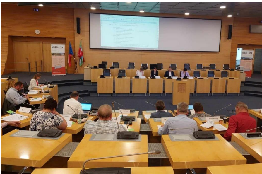
Jednání Sněmu Hospodářské a sociální rady Ústeckého kraje