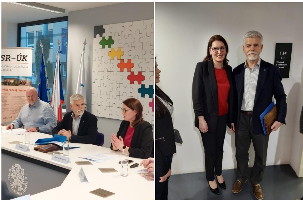
Setkání HSR-ÚK s prezidentem Petrem Pavlem na půdě Univerzity Jana Evangelisty Purkyně v Ústí nad Labem při příležitosti jeho návštěvy Ústeckého kraje.

Velmi důležitým jednáním bylo únorové setkání HSR-ÚK s nově zvoleným prezidentem Petrem Pavlem na půdě Jana Evangelisty Purkyně v Ústí nad Labem.