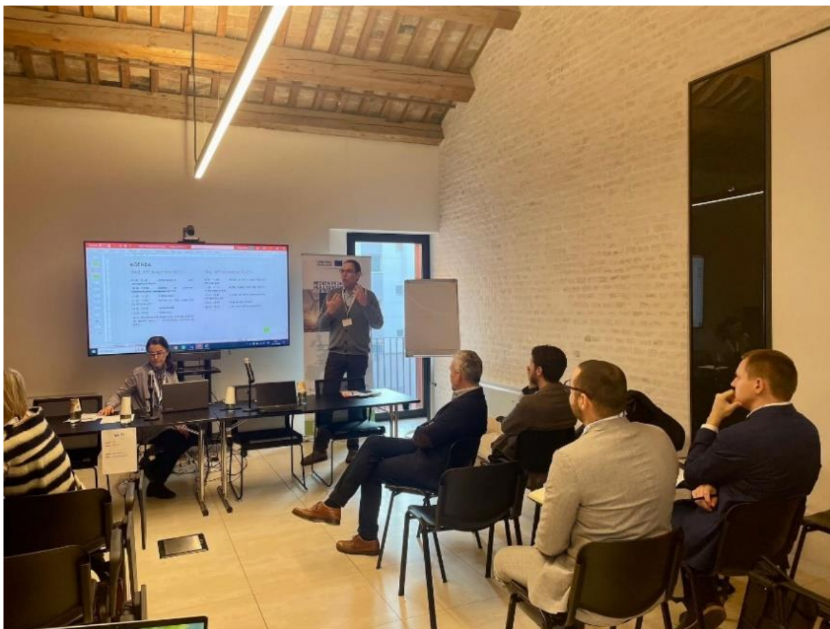
Zástupci HSR-ÚK na konferenci v Benátkách, realizované v rámci projektu H2CE

Mimo standardní činnosti pro realizaci projektu a online jednání se zástupci HSR-ÚK z řad realizačního týmu zúčastnili v dubnu letošního roku Kick-off jednání v německé Postupimi. Dále konference v italských Benátkách, kde tlumočili potřeby Ústeckého regionu. Ve spolupráci s dalšími partnery projektu nastavili další kroky směrem k iniciaci a smysluplnému nastavení služeb středoevropské sítě.