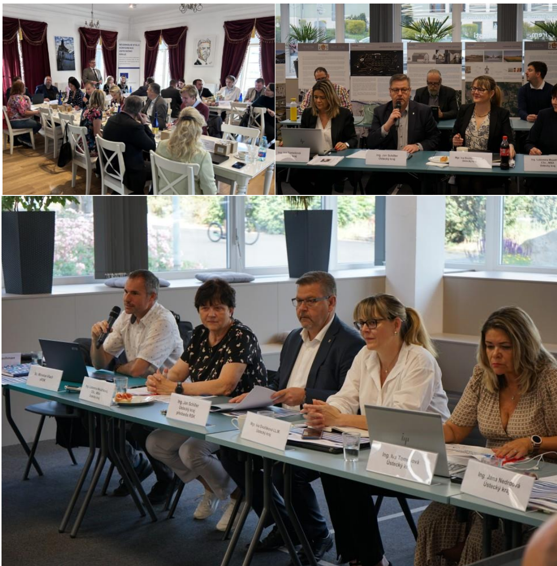
Zasedání Regionální stálé konference Ústeckého kraj