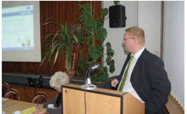
HSRM se intenzivně zajímala o důvody, proč Most nezískal dotace na Integrovaný plán rozvoje města. Pozvala si na své jednání přímo ředitele Úřadu regionální rady regionu soudržnosti Severozápad Petra Vráblíka (na snímku). Do této chvíle se podařila alespoň jedna věc ve prospěch Mostecka – Helena Veverková se stala členem monitorovacího výboru.