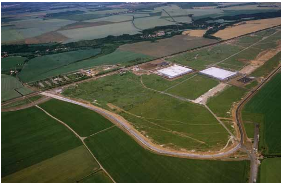
Průmyslová zóna Triangle na Žatecku zaměstnala i obyvatele z Mostecka.