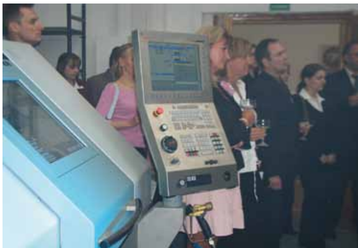
Snímek z otevření Krajského vzdělávacího centra v Mostě.