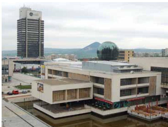
Jednou ze zvláštností Mostu je i planetárium, které sídlí v kopuli Reprezentačního domu města.

luprání na společné prezentaci a propojit nejdůležitější užitečné informace, je vznik poradního orgánu pro CRTM, o jehož jmenování dlouhodobě usilují. Poradním orgánem rozumím průřezové seskupení osob působících v oblasti cestovního ruchu v nejbližším smyslu. Jeho posláním by mělo být propojení podnikatelských aktivit měst a obcí. Měl by přinášet náměty a potřeby zvenku, koordinovat akce a termínové kalendáře v regionu, nápady na společnou prezentaci regionu. Důležitým prvkem je to, aby členové poradního orgánu byli otevření požadavkům zbývajících zástupců podnikajících v cestovním ruchu a vzájemně se informovali. Partnerem poradního orgánu CRTM by měla být rovněž média na bázi reklamní spolupráce.