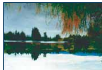
HIPODROM MOST a.s. www.hipodrom.cz