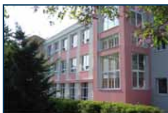
Vysoká škola finanční a správní, o.p.s., Most www.vsfs.cz