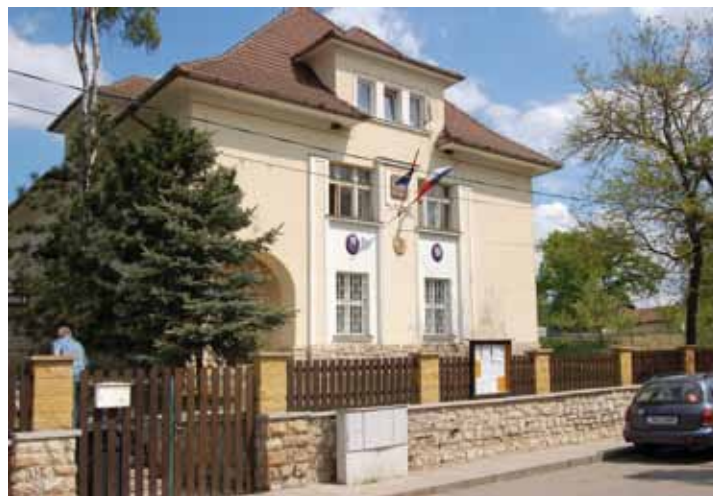
Obce dostaly příspěvek na zhotovení obecního znaku a vlajky.