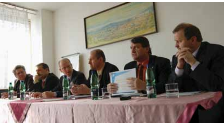
Vloni v únoru v Mostě jednal rozpočtový výbor parlamentu.