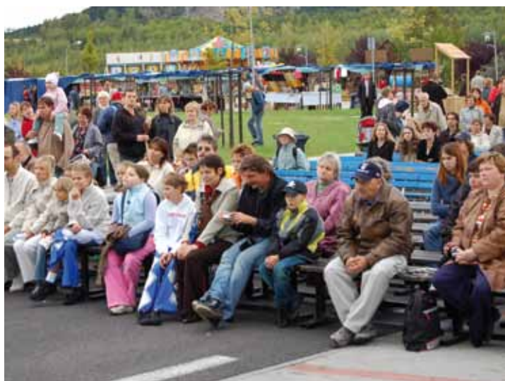
Mostecké slavnosti, které se konají u přesunutého děkanského kostela, jsou již tradičním turistickým lákadlem na podzim.