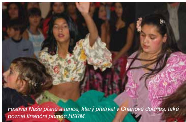
Festival Naše písně a tance, který přetrval v Chanově dodnes, také poznal finanční pomoc HSRM.