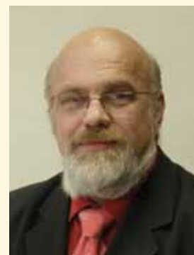
Miroslav Huml , starosta Města Meziboří