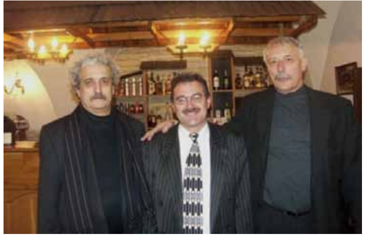
V roce 2004 byla HSRM poctěna návštěvou ministra kultury Pavla Dostála (vlevo), který se nechal zvéctnit po posezení v restauraci U svatého Ducha v Mostě.