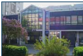
Výzkumný ústav pro hnědé uhlí a.s. www.vuhu.cz