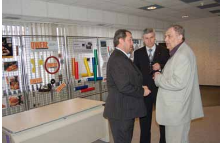
V sídle OHK Most se etabloval základ pro Vzorkovnu Mostecka.

Ve stínu tohoto zůstala řada drobnějších aktivit, z kterých bych zdůraznil jednu, která měla pro podnikatelské prostředí, ale i pro investiční potřeby obcí obrovský význam a bohužel s podstatou problému se zápasí dodnes. Byla to myšlenka také inspirovaná podnikatelským poznáním a zkušeností o 10 až 20procentní úspěšnosti nápadů a námětů, které zůstávaly pouze v hlavách a jejich převedení do dokumentační formy pro další projekční rozpracování právě pro velkou míru rizika neúspěšnosti nebylo realizováno. Mluvíme o projektu Fondu podpory projektů, který přivedl na svět a do realizace řadu nápadů, které by v prostředí malého a středního podnikání, včetně