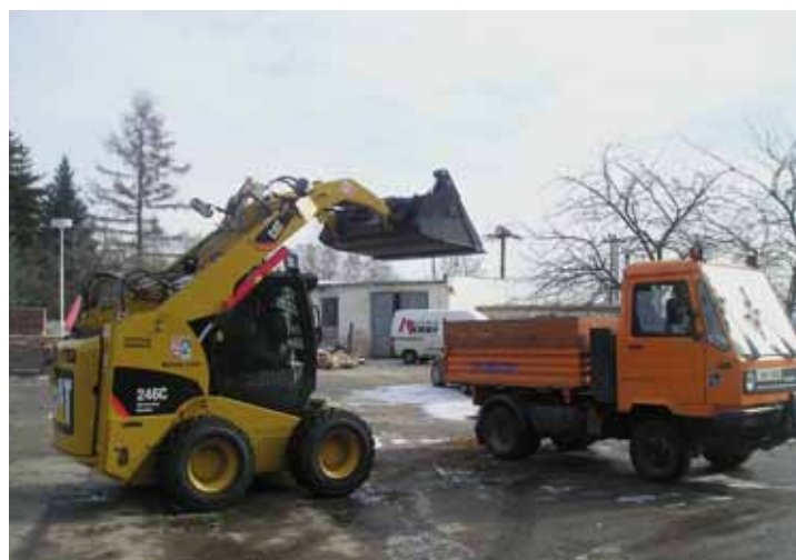
Záběr z realizace projektu z 15 miliard.