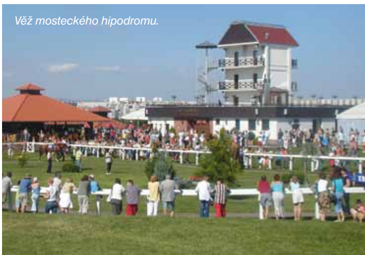
Věž mosteckého hipodromu.

Vzniklo na základě podpisu dohody deseti subjektů: Celio, a.s., ČIŽP Ústí nad Labem; Česká rafinérská, a.s.; Chemopetrol, a.s.; Mostecká uhelná společnost, a.s.; Okresní hygienická stanice Most; Podnikatelské a inovační centrum Severní Čechy; Povodí Ohře, a.s. Chomutov; Úřad práce Most a Výzkumný ústav pro hnědé uhlí, a.s. Spustily se webové stránky www.ecmost.cz , které se postupně začaly naplňovat řadou informací o životním prostředí Mostecká. Následně se Ekologické centrum v budově VÚHU otevřelo pro veřejnost a zprovoznila se bezplatná linka 800 195 342. Centrum dnes nabízí služby pro školy, obce, podniky i neziskové organizace, například výukové programy, semináře, projekty, zpracování environmentálně osvětových materiálů a podobně.