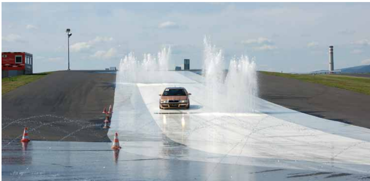
Polygon je jedním z úspěšných příkladů revitalizace krajiny díky 15 miliardám vyčleněných vládou jako naplňování GPR na Mostecku, kde došlo k financování úpravy území výsypky z 15 miliard korun a komerční výstavbě polygonu ze soukromých zdrojů.