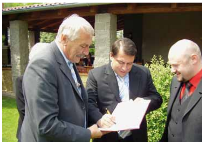
Jiří Paroubek přijal pozvání do Mostu.