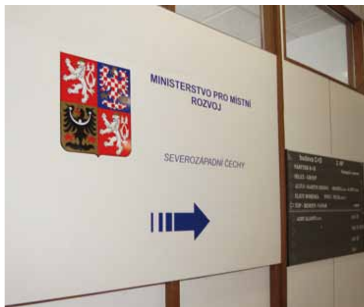
Regionální pracoviště ministerstva pro místní rozvoj v Mostě sídlí na stejném patře jako HSRM.

■ Řešení dopravní infrastruktury a v té době aktuální problematiky související s hraničními přechody (silnice Mníšek, I/27) atd.