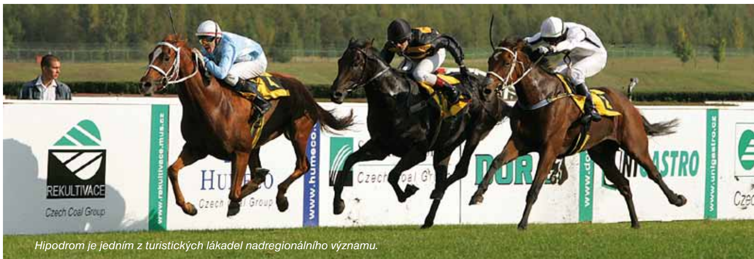
Hipodrom je jedním z turistických lákadel nadregionálního významu.

Nápadů mají členové komise řadu. Některé jsme už prezentovali.