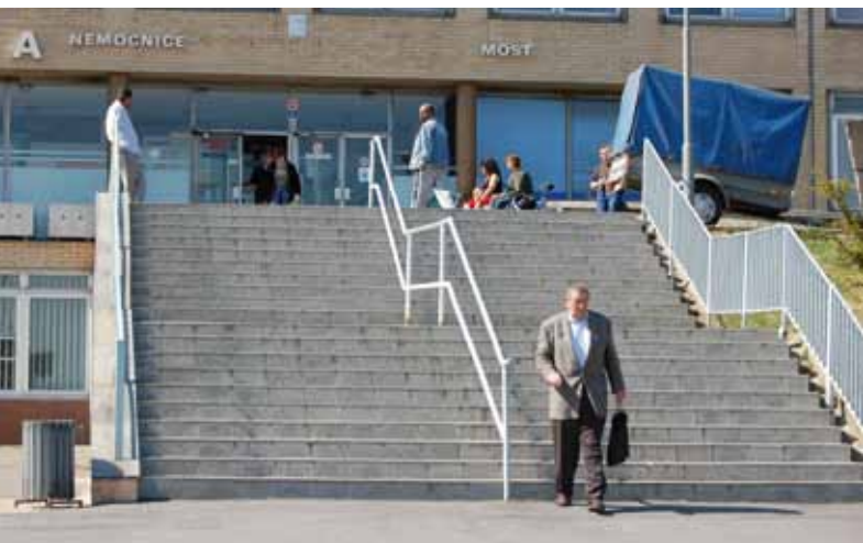
Budoucnost nemocnice po plánované transformaci byla jedním z témat roku 2007.