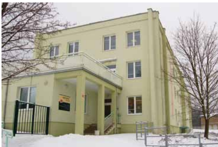
HSRM podpořila projekt Hospice v Mostě.