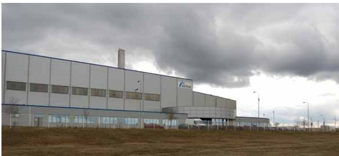
Průmyslová zóna Joseph na Mostecku.

■ Revitalizaci krajiny narušené lidskou činností na území severozápadních Čech (především prostřednictvím