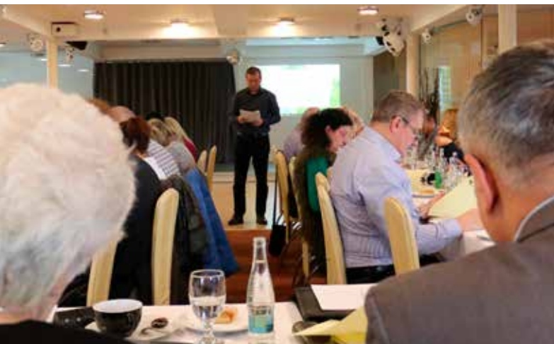
Informace finanční komise jsou pravidelně součástí jednání hospodářské rady