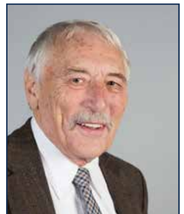
JUDr. Richard Falbr