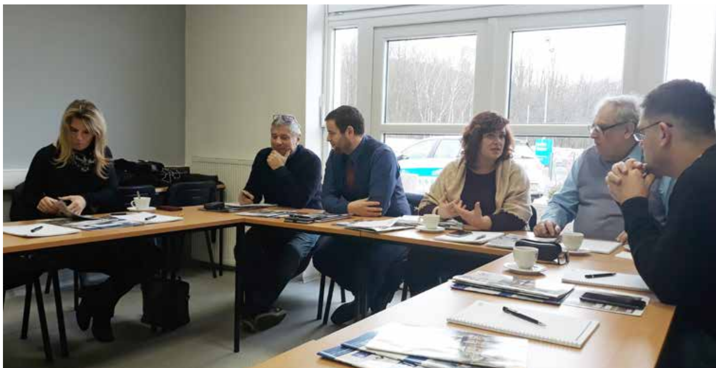
Jednání pracovní skupiny SPO-NA

činnosti rady, je neúčast některých obcí a zejména města Litvínov v týmu HSRM. Je mnoho problémů společných a kromě konfliktního tématu těžby uhlí, je celá řada dalších témat, která jsou pro region a oblast důležitá. Oblast dopravy, životního prostředí, vzdělávání, kriminality, sociální problematika a řada