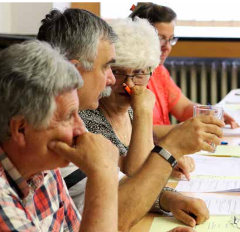
Z pravidelného jednání mostecké rady