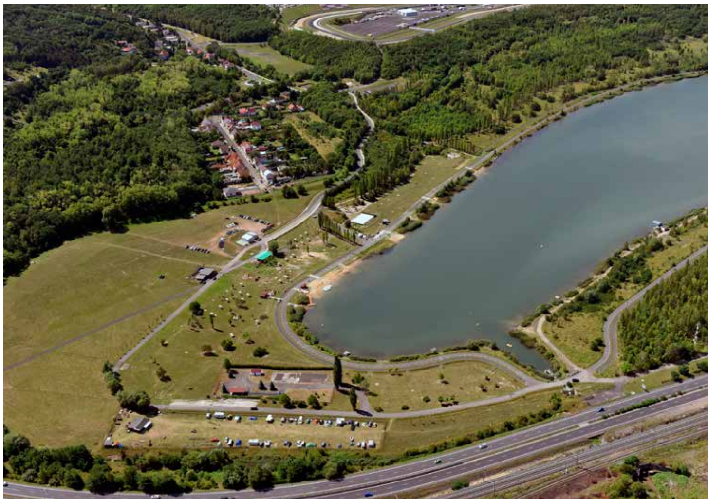
Cyklostezky a in-line dráha v okolí nádrže Matylda

V oblasti revitalizačních obecních projektů bylo dosud pouze na území celého Ústeckého kraje dokončeno celkem 34 akcí, z toho 14 na Mostecku. Patří mezi ně například příprava území pro individuální výstavbu – na Čepirožské vysypce v Mostě, v Havraní, či v Louce u Litvínova. Realizována byla i řada projektů pro rekreační využití území, jako areál okolí vodní nádrže Matylda v Mostě či rekreační plocha Nové Záluží v Litvínově. Mezi