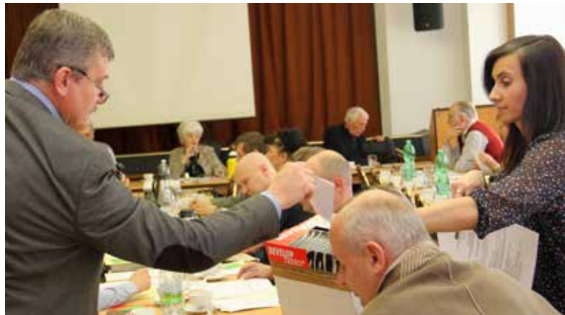
Součástí života Hospodářské a sociální rady jsou také volby, v tomto případě v březnu 2017 bylo potřeba dovolit členy předsednictva.