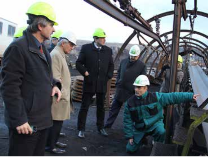
Během výjezdního zasedání zavítali členové Rozpočtového výboru Poslanecké sněmovny Parlamentu ČR také do lomu Československá armáda společnosti Severní energetická, a.s..