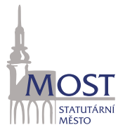
Statutární město Most www.mesto-most.cz