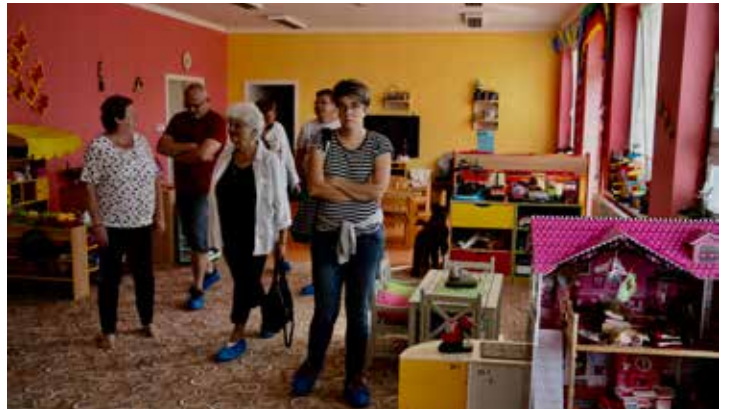
Komise cestovního ruchu při HSRM uspořádala pro členy rady exkurzi po úspěšně zrealizovaných projektech, které regionální tripartita podpořila. Jednou ze zastávek byla mateřská škola v Havrani.