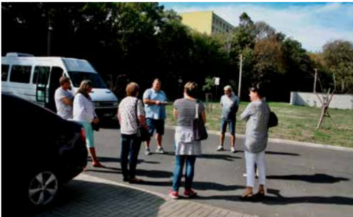
Další ze zastávek exkurze po úspěšně zrealizovaných projektech podpořených HSRM byla v Obrnicích.