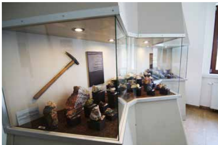
Expozice rudného dobývání v Podkrušnohorském technickém muzeu