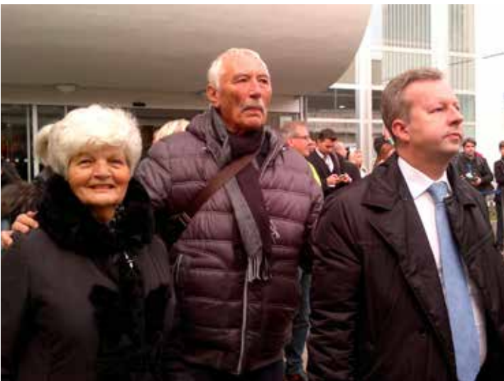
Zástupci regionální tripartity přišli v roce 2015 podpořit hornické odbory na protestní akci do Ústí nad Labem nazvanou Mostecko – nenecháme se odpískat.