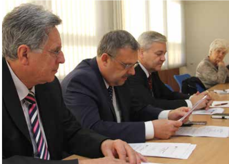
Součástí výjezdního zasedání rozpočtového výboru PSP bylo i krátké setkání s novináři na mezibořské radnici.