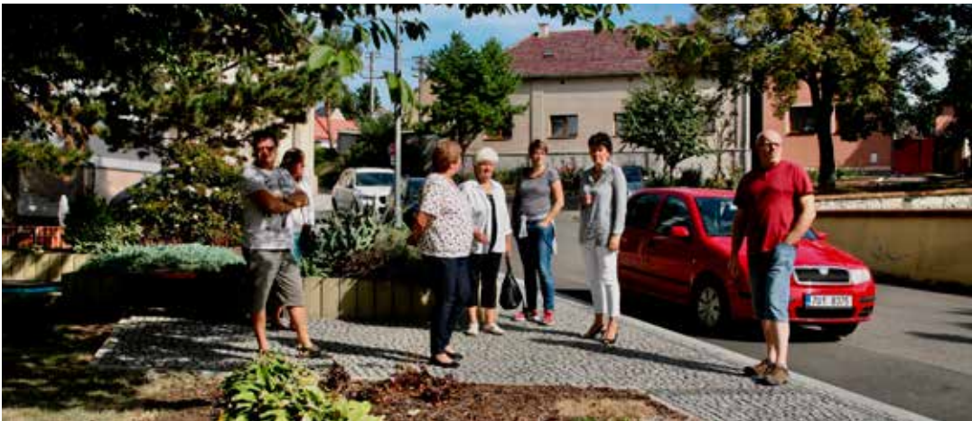
Exkurze pro členy HSRM po úspěšně zrealizovaných projektech, které regionální tripartita podpořila, zavedla její účastníky také do Skršína.