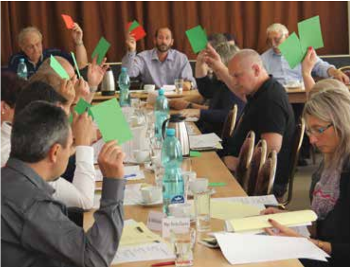
Dvakrát ročně se koná Sněm HSRM, který rozhoduje o nejdůležitějších krocích pro budoucnost regionální tripartity.