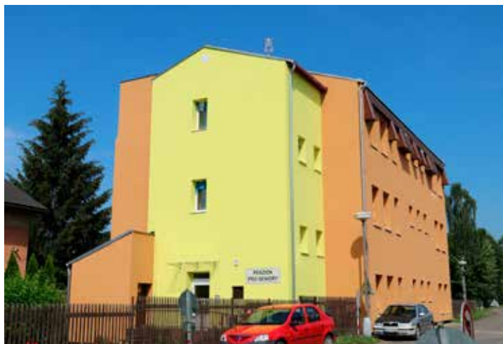
HSRM podpořila projekt zateplení penzionu pro seniory v Louce u Litvínova