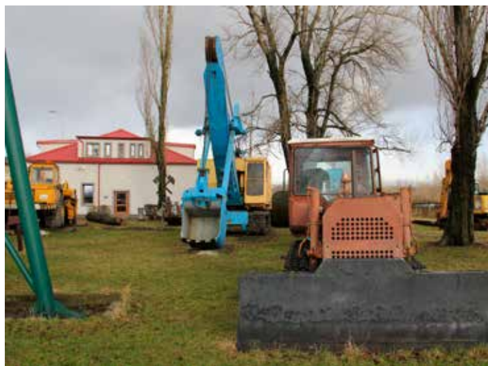
Podkrušnohorské technické muzeum získalo podporu na rekonstrukci objektu