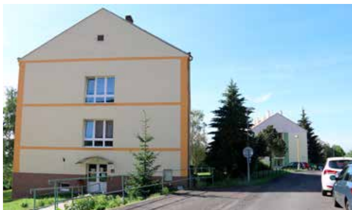
V Lomu díky podpoře HSRM mohli zateplit plášť budovy penzionu pro seniory